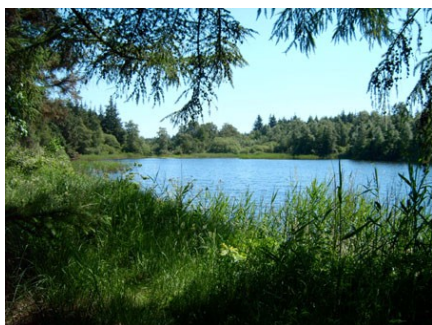
See in der Bordelumer Heide

Zu beiden Seiten der Bundesstraße 5 erstrecken sich vom Stollberg aus zwei Naturschutzgebiete mit vielen Wanderwegen, vorbei an idyllischen Seen. Nördlich geht der oben erwähnte Naturerlebnisraum direkt in die Langenhorner Heide über. Westlich des Stollbergs liegt zwischen der B 5 und der Bahnlinie zunächst ein kleines Waldgebiet und hinter der Bahnlinie dann die Bordelumer Heide .