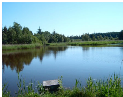
See in der Langenhorner